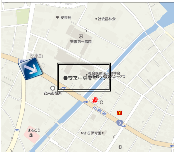
7/8 安来会場 安来中央交流センター (安来市中央公民館) 安来市安来町 896-1