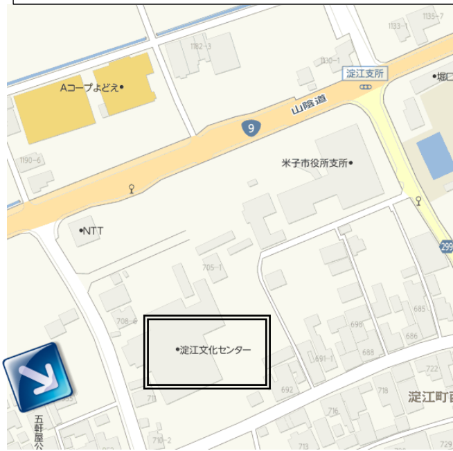
7/7 淀江会場 米子市淀江文化センター 米子市淀江町西原 708-4