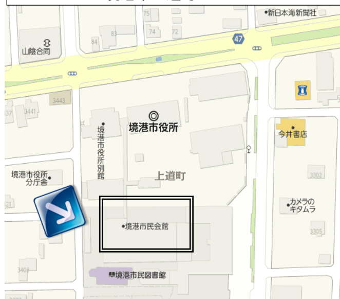
7/8 境港会場 境港市民会館 境港市上道町 3000