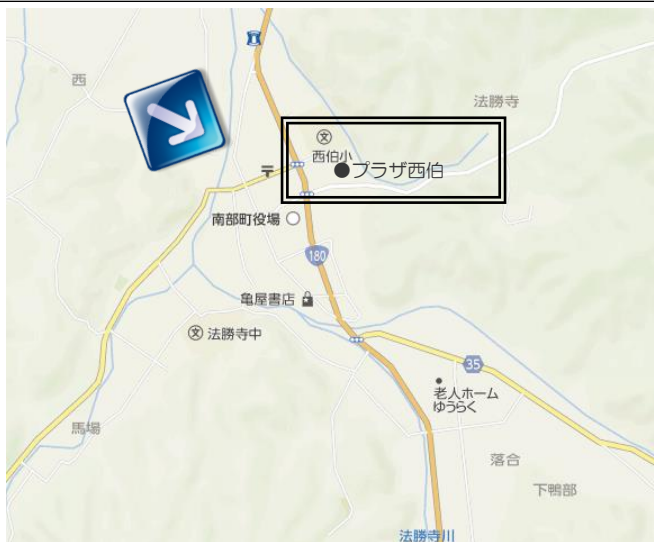
7/9 南部会場 プラザ西伯 西伯郡南部町法勝寺 167-2