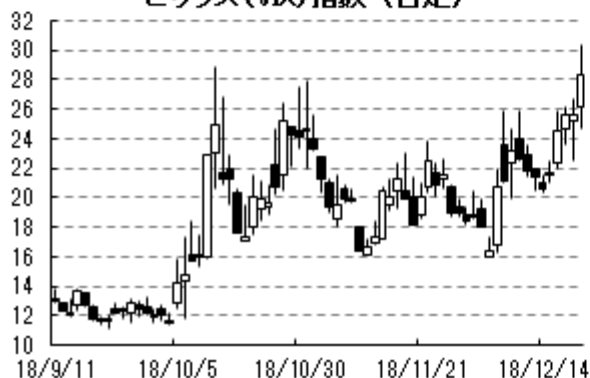
ビックス(VIX)指数 (日足)