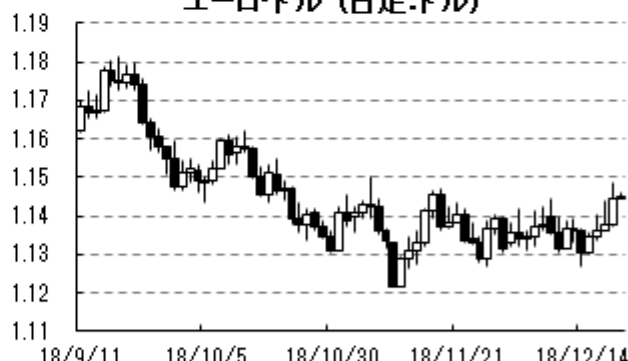
ユーロドル (日足:ドル)