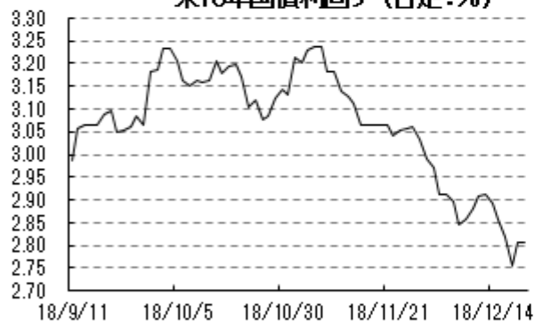
米10年国債利回り (日足:%)