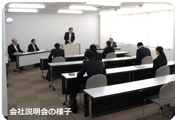
会社説明会の様子