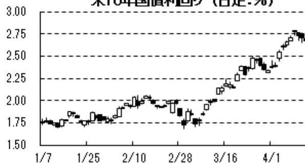
米10年国債利回り (日足:%)