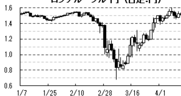
ロシアルーブル円 (日足:円)